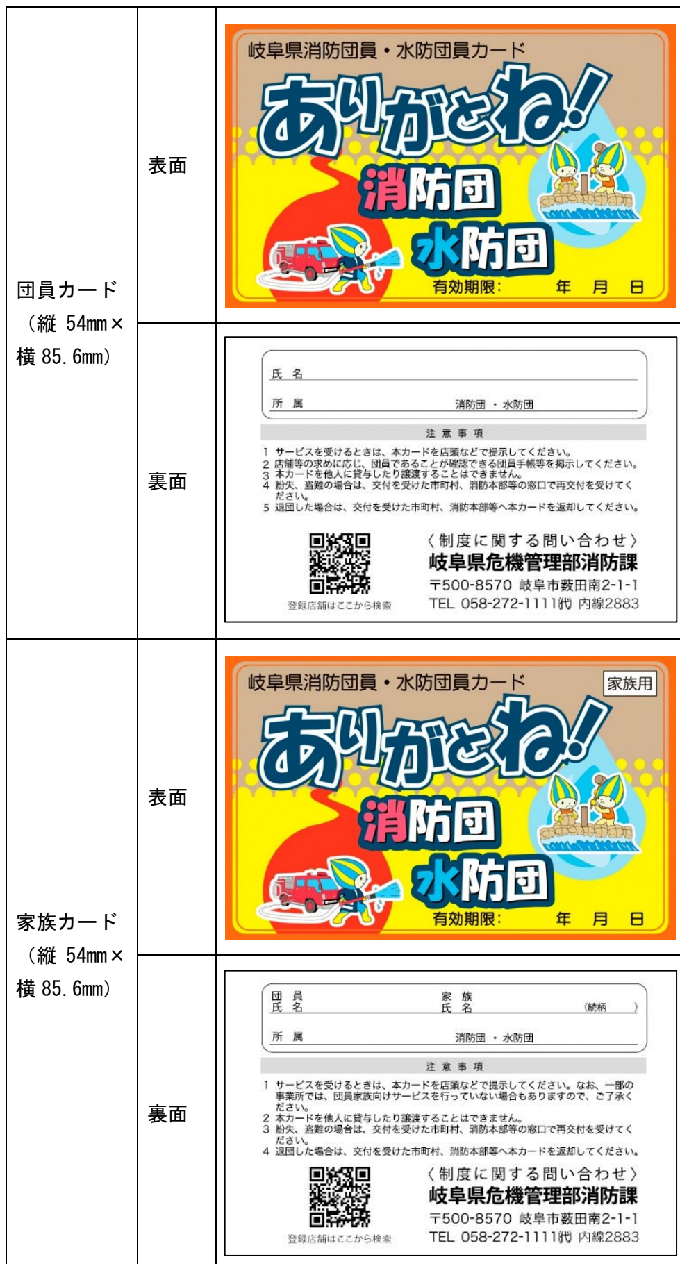
別表（第4条及び第6条関係）